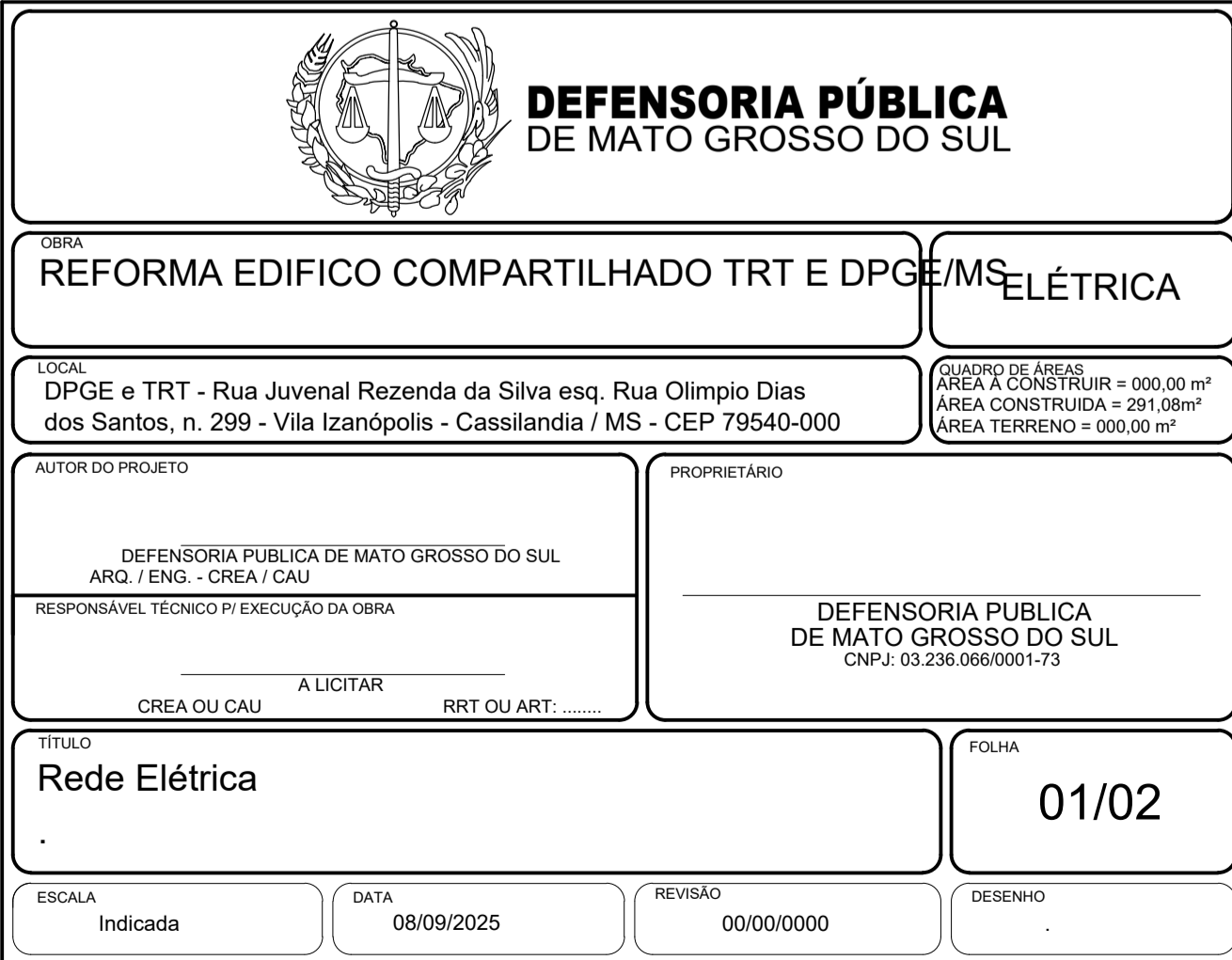
Planta Baixa - Rede Elétrica ESC. 1: 75

ESPAÇO INFORMATIVO / CARIMBO ÓRGÃOS PÚBLICOS / NÃO ALTERAR